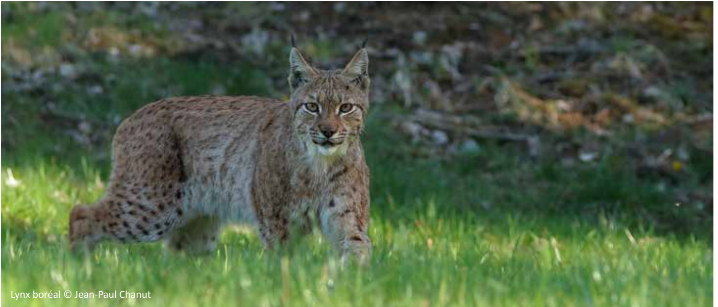
Lynx boréal

Parce que la protection des espaces et des espèces passe avant tout par la connaissance, la LPO AuRA et FNE AuRA se sont associées en 2014 autour d'un projet commun : la création d'un atlas des mammifères de Rhône-Alpes. Aujourd'hui, nous avons le plaisir de vous annoncer la sortie officielle de cet atlas, 100 % numérique et 100 % gratuit.