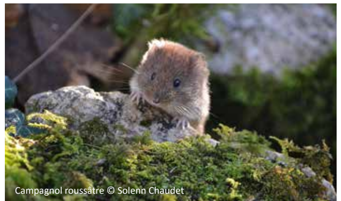
Campagnol roussâtre

Outre les quelques espèces de grands mammifères, les plus petits mammifères sont aujourd'hui peu considérés, et on estime qu'il existe encore de nombreuses informations à découvrir sur ces petits animaux qui sont les plus nombreux !