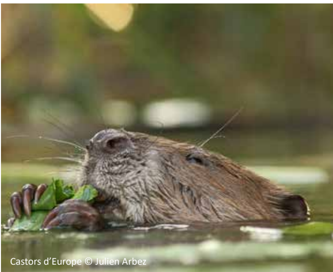
Castors d'Europe

Des passages à castor ont également été installés sur certains ouvrages hydrauliques pour favoriser leur déplacement.