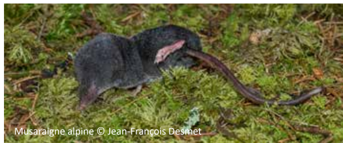
Musaraigne alpine

La musaraigne alpine ne subit pas directement de menaces. Elle n'est pas protégée au niveau régional ni national. En revanche, tous les milieux qu'elle affectionne (frais et humides) sont aujourd'hui menacés par le changement climatique, et ses populations, bien que l'état soit mal connu en Rhône-Alpes, sont considérées en régression à l'échelle européenne.