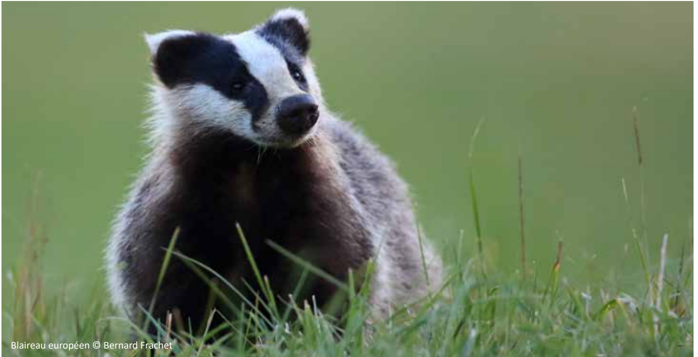
Blaireau européen

Ce mustélidé est un mammifère mal connu, bien que largement répandu. Nocturne et casanier, on ne le croise malheureusement que trop souvent mort écrasé sur les routes... Carnivore, il reste très opportuniste et peut se nourrir de tout ce qu'il trouve, dont une bonne partie de végétaux. Il est le seul mustélidé à avoir une vie sociale. Les clans peuvent se composer de 2 ou 3, voire jusqu'à 10 individus.