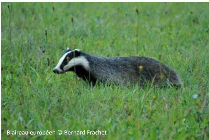
Blaireau européen

De par les problèmes de cohabitation qu'il cause (création de terriers, destruction de cultures...) et sa faible notoriété, le blaireau souffre d'une mauvaise image auprès du public.