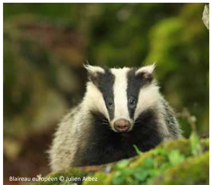
Blaireau européen

L'étude du blaireau européen dans le cadre de l'atlas des mammifères de Rhône-Alpes a permis d'augmenter le nombre de données et donc d'apporter une meilleure connaissance de la répartition de l'espèce sur le territoire.