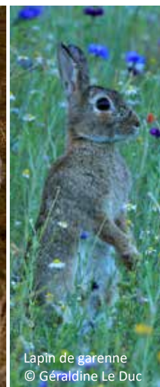
Lapin de garenne © Géraldine Le Duc