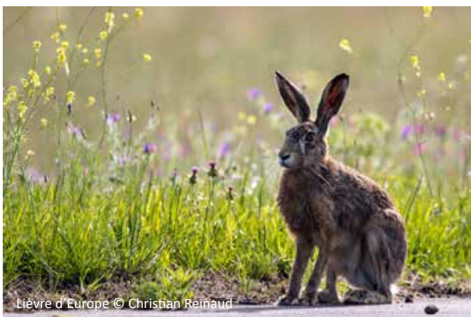
Lièvre d'Europe