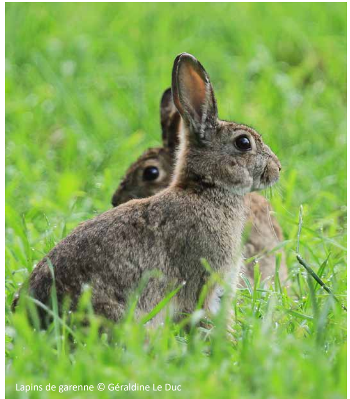
Lapins de garenne

Les observations de 2005 à 2018 montrent que ces trois espèces représentent 11 % de toutes les données de mammifères : 7,8 % pour le lièvre d'Europe, 3 % pour le lapin de garenne et 0,3 % pour le lièvre variable.