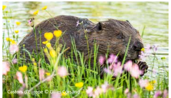
Castors d'Europe