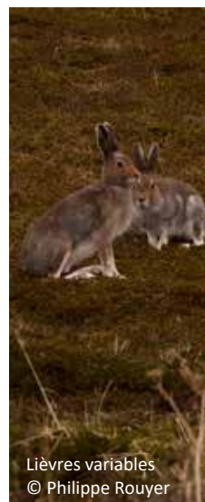
Lièvres variables