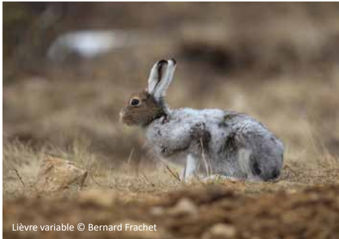
Lièvre variable

De par leurs habitats, les trois espèces ne sont pas toujours présentes aux mêmes endroits. En effet, le lapin de garenne et le lièvre d'Europe sont moins présents en altitude à l'est de la région, plus propice à la présence du lièvre variable, lagomorphe strictement montagnard.