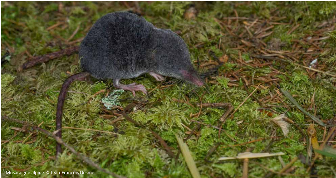
Musaraigne alpine

La musaraigne alpine est l'un des mammifères les moins connus de la faune française. En effet, peu de données ont été collectées sur cette espèce et la répartition des populations est plutôt réduite et très localisée.