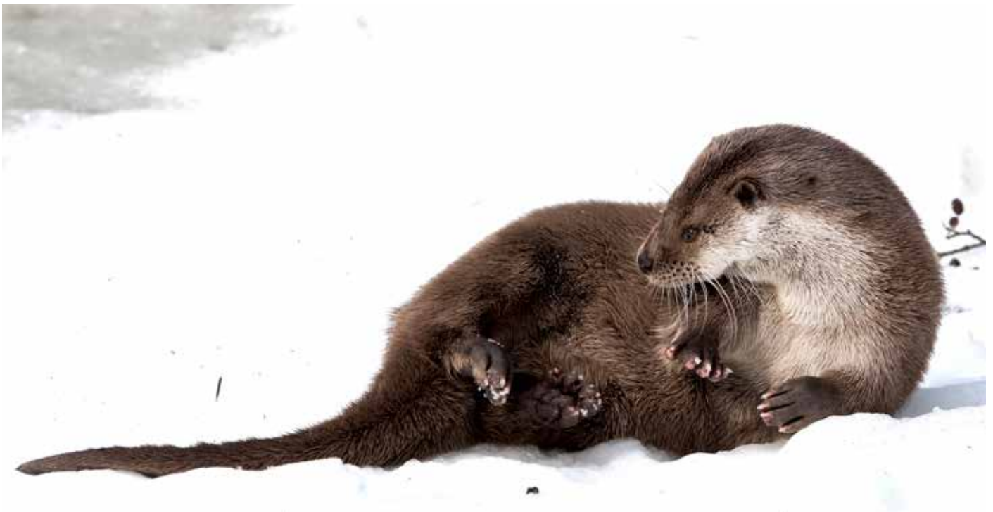
Loutre d'Europe