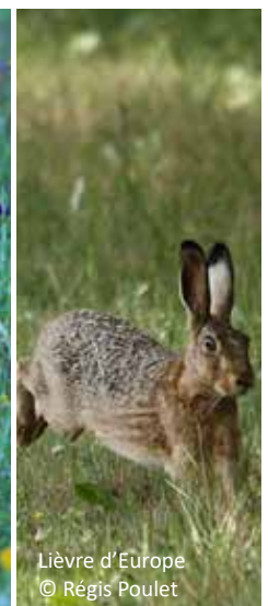
Lièvre d'Europe