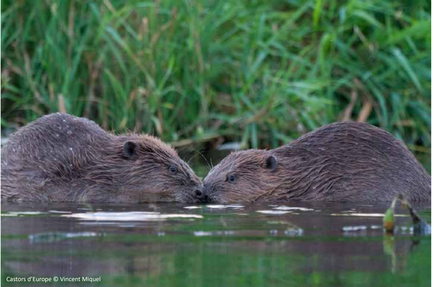
Castors d'Europe

Le castor d'Europe, autrefois appelé « bièvre », est un rongeur bien connu pour ses caractéristiques d'animal sociable et travailleur.