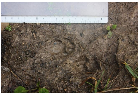
trace de chat sauvage, souille de sanglier.

Le groupe ayant mis en place les pièges INRA a eu l'occasion d'entendre le chant de la discrète chouette chevêchette.